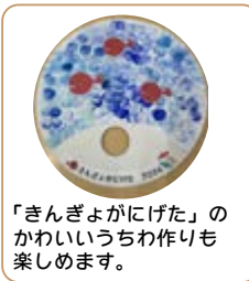
「きんぎょがにげた」の かわいいうちわ作りも 楽しめます。